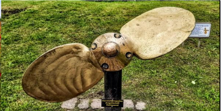
Büsum, ein Verstellpropeller, er hat seine Arbeit getan und erfreut nun den Betrachter...