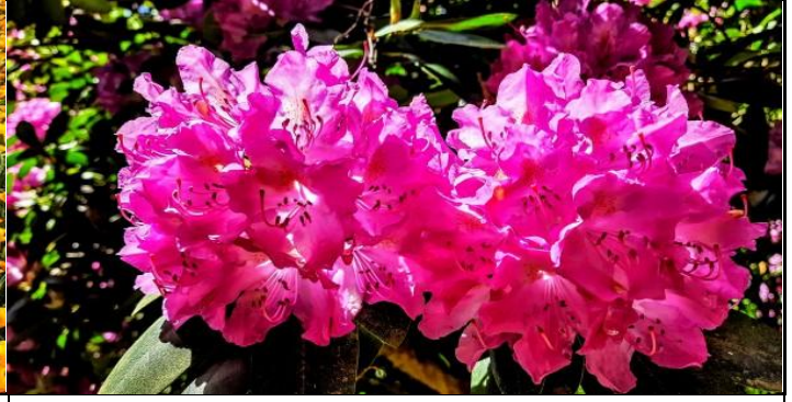
Und wie jedes Jahr blüht der Rhododendron in einer Allee neben dem Schloss Hagenburg...