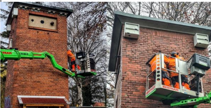
Der Bauhof der Stadt Bad Nenndorf unterstützt uns, den NABU, bei der Anbringung von Nistkästen an einem alten Trafoturm in Horsten...