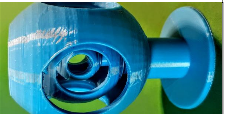
Mit dem 3-D Drucker sind Formen zu realisieren, welche sonst nicht herstellbar sind, hier Kugeln in Kugeln, um 90° gekippt...