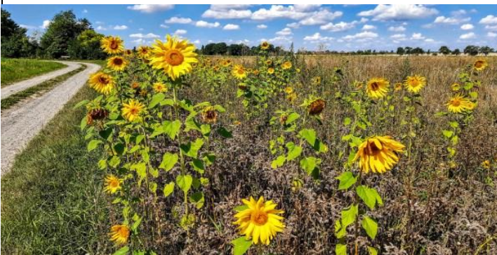
So schön können Wegraine sein, noch besser ist es, wenn sie nicht stückweise umgepflügt werden und die Pflanzen stehen bleiben dürfen...