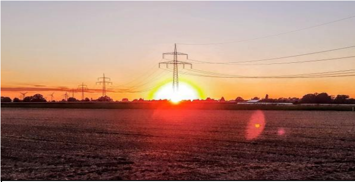
Hier der Beweis das unsere Enegie von der Sonne stammt...