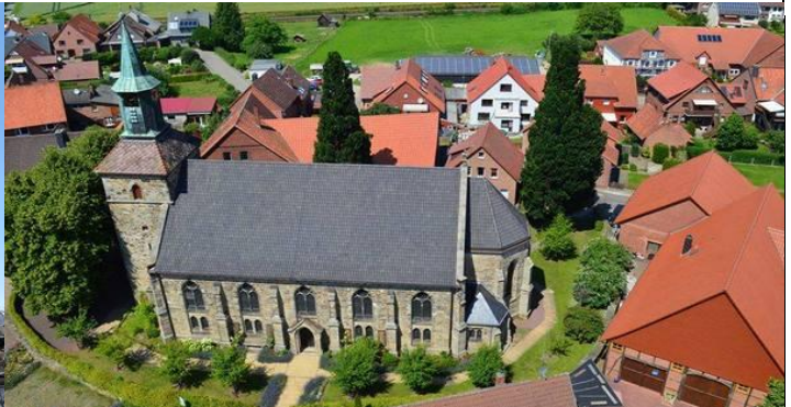
Luftaufnahme der Martinskirche in Hohnhorst, meiner Heimatgemeinde...