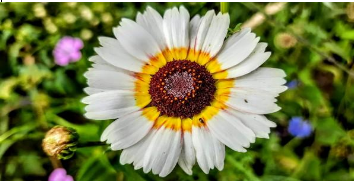
Eine strahlende Margarite, sie reflektiert die Sonne...