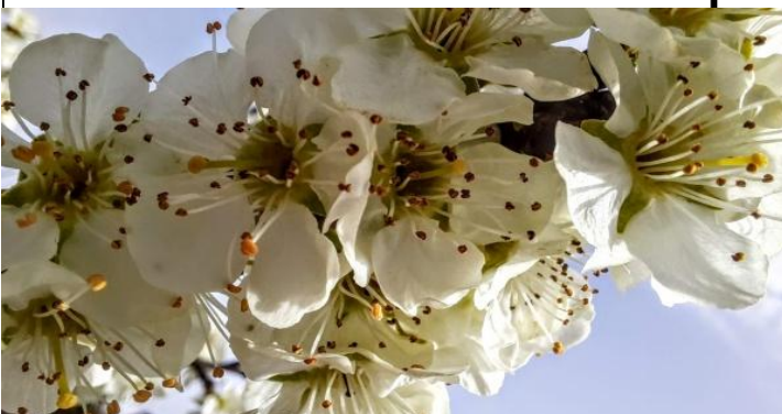
Wie jedes Jahr kündigt uns der im Überschwang blühende Birnbaum den nahenden Frühling...