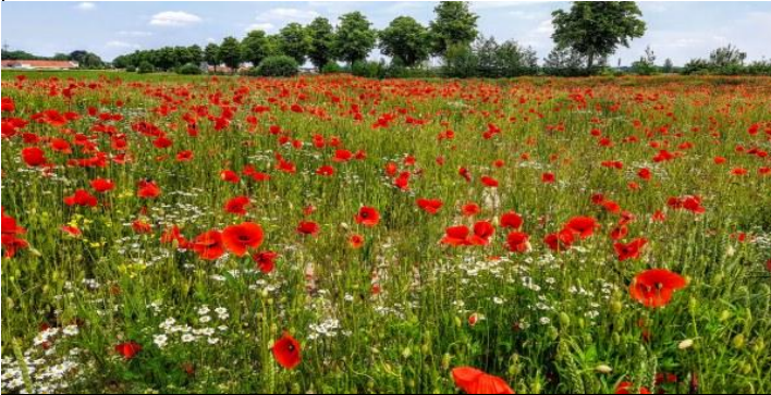
Blick über ein Mohnfeld auf meinen Heimatort Haste, hier lässt es sich gut leben...