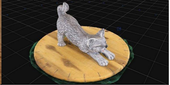
Photogrammetrie, viele Bilder werden gemacht und in einer komplexen Software zu einem druckbaren Modell zusammengefügt...