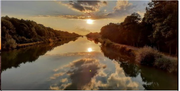
Der Mittellandkanal mit sinkender Sonne und zauberhafter Spiegelung...