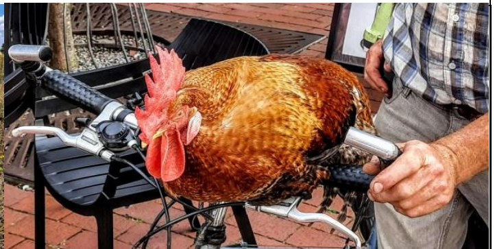
Ein zahmes Huhn, so gesehen in Wunstorf, es sitzt auch bei voller Fahrt auf dem Fahrradlenker...