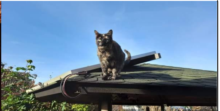
Eine unserer Katzen auf dem Dach des Gartenpavillons, vorher hat sie die kleine Experimentier-Solaranlage inspiziert...