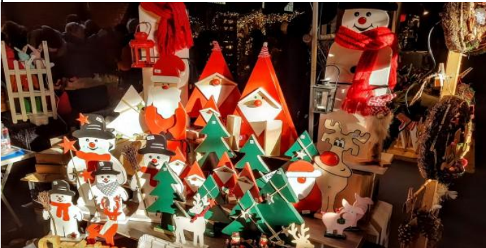
Erste Weihnachtsdekorationen tauchen auf und künden den nahenden Advent an...