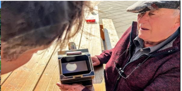
Eine partielle Sonnenfinsternis, ich zeige den Schulkindern in der Grundschule Haste mit einem Sonnenprojektor vollkommen gefahrlos den Verlauf...