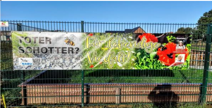
Als Aktivist im NABU versuche ich die Menschen zu naturnahen Gärten zu bewegen...