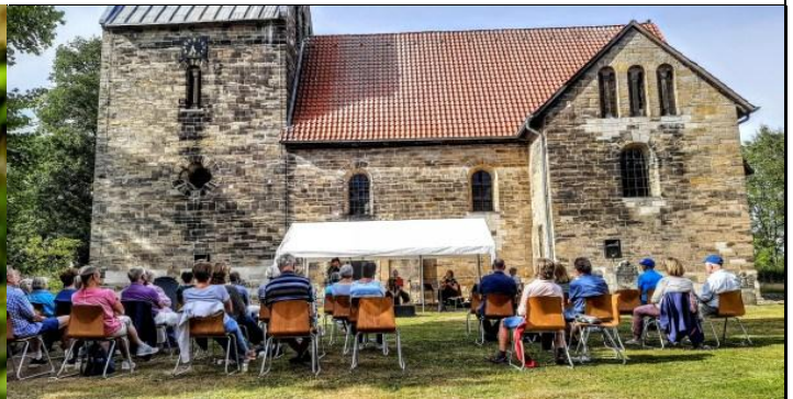
Ein musikalischer Leckerbissen an der Sigwardskirche in Idensen, der unermüdliche Helmut organisiert solches...