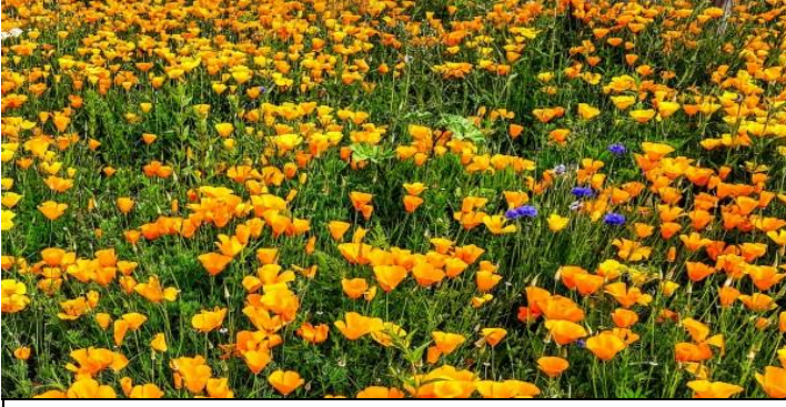
Auf dem Weg nach Bad Nenndorf, Blütenüberfluss soweit das Auge reicht...