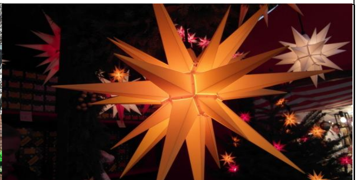
Ein Herrnhuter Stern, er weist uns den Weg zur Krippe, zu Weihnachten, zur Geburt von Jesus Christus...