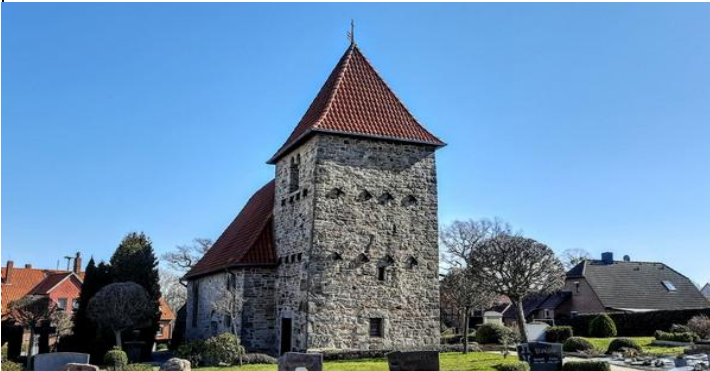
Eine uralte Feldsteinkirche in Bantorf, so gesehen auf einer Radtour zur Deister Alm...